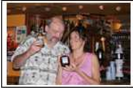
Congratulations to the winners!