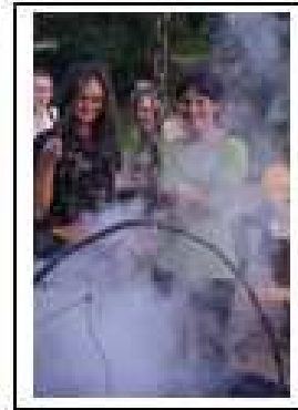
The night's entertainment!